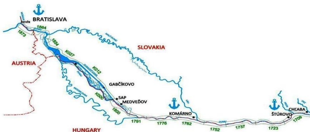
Obrázok 1: Lokalizácia slovenských verejných prístavov

Spoločnosť Verejné prístavy, a. s. prevádzkuje verejný prístav v Bratislave, Komárne a Štúrove.